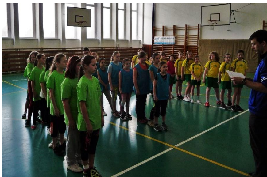
Autor: Nela Březinová

Byla to super hra a naučily jsme se správně hrát!!